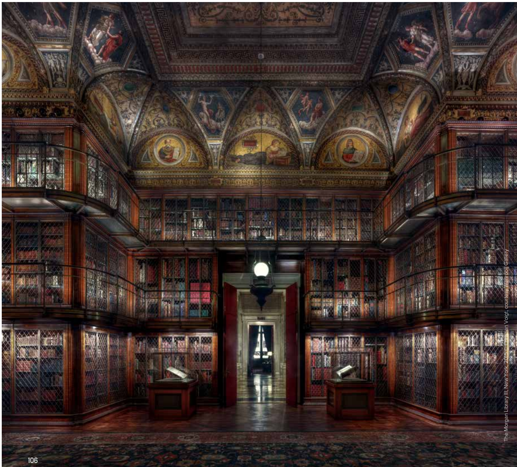
The Morgan Library III, New York, 2015

Een daverend succes werd Hall of Fame , een foto van de Erezaal in het Rijksmuseum. Voigt had al ervaring met het fotograferen van soortgelijke locaties, zoals The Morgan Library in New York. Nadat galerist Martijn Wanrooij zich een half jaar had ingespannen om dit unieke project te realiseren, kreeg Christian Voigt eindelijk de kans de Erezaal te fotograferen. Maar dat moest wel in de avonden. “Wanneer je helemaal alleen voor De Nachtwacht staat, met niets dan stilte om je heen, dan voelt het net als een film. Die stilte en imposante rijkdom die het museum uitstraalt, heb ik geprobeerd vast te leggen.” Hij reist van de ene naar de andere uitdaging. Van de stilte in het Rijksmuseum naar de zinderende woestijn in de Emiraten naar de rijstvelden op Bali. Voor een van zijn recente projecten legde hij de lat, letterlijk en figuurlijk, extreem hoog: Mount Everest. No sky is the limit! “Mijn doel was om gedurende de piektijd van het klimmen de foto te maken van Everest Base Camp, met de moeder aller bergen op de achtergrond.” De foto toont niet alleen het basiskamp en de bedrijvigheid, het is een panoramafoto van ongekende kwa-