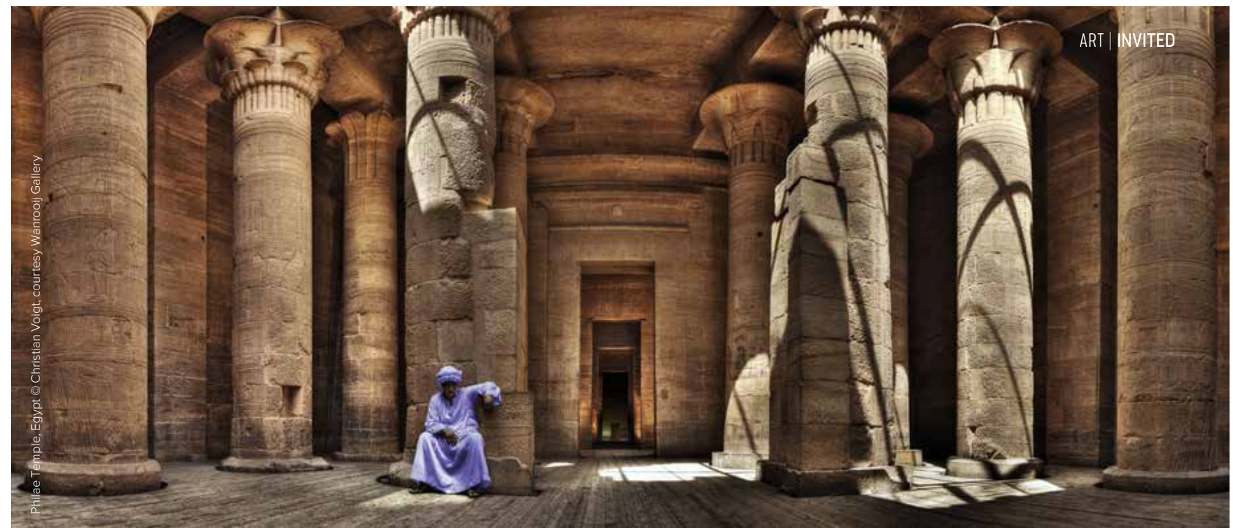
Philae Temple, Egypt

Niet alleen zijn ambities zijn groot, zijn foto's zijn dat ook. De werken die hij maakt, van landschappen, steden en iconische plekken zoals de Klaagmuur in Jeruzalem en Central Park in Manhattan, meten soms 1,80 bij 3,50 meter. Je krijgt ze je huis nauwelijks in! En dan de scherpte, de helderheid. Hoe krijgt hij het voor elkaar? Christian Voigt – geboren in München, woonachtig in Hamburg en Saint-Tropez – licht een tipje van de sluier op. “Ik houd van grote foto's omdat die het de toeschouwer makkelijker maken om in de afgebeelde wereld te stappen. Om grote afdrucken te kunnen realiseren, moet ik meerdere foto's maken en als een puzzel in elkaar schuiven. Want één enkele foto kan natuurlijk nooit tot zulke proporties worden opgeblazen zonder kwaliteitsverlies.” Dat elke vierkante centimeter van de print het perfecte contrast heeft, bereikt hij eveneens door het maken van meerdere foto's. “Soms wel tientallen, met steeds een andere belichtingswaarde, zodat het van de hoogste lichten tot de diepste schaduwen ideaal belicht wordt.” Door opnames te combineren ontstaat een technisch uitmuntende afdruk.